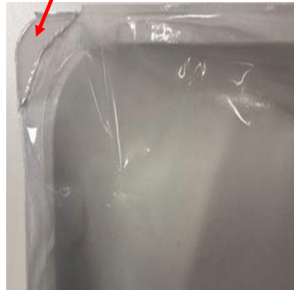
Lipje met perforaties om open te trekken