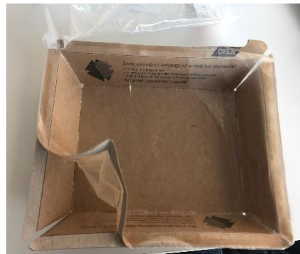
Séparation film laminé plastique du carton (ex.2)