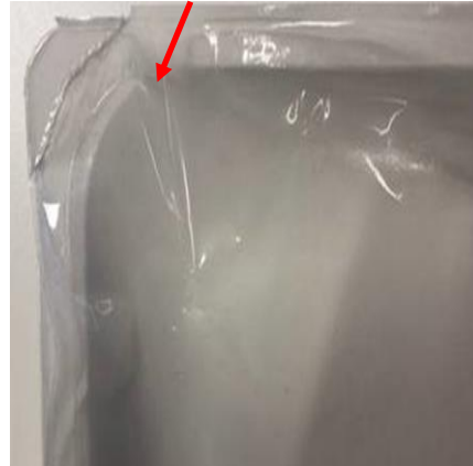
Languette d'arrachage avec perforations